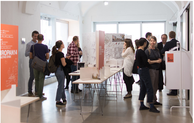
Ausstellung der Siegerprojekte an den Standorten

LEISTUNGSPAKET: Gesamtorganisation, Moderation, Preisgelder, Ausstellung, Kongresse, Publikationen, Workshops. Dank bestehender Fördermittel vom Bund erhalten EUROPANs Standortpartner:innen das EUROPAN Gesamtpaket zu einem außerordentlich günstigen Preis. Der auf drei Jahre aufgeteilte Finanzierungsbeitrag kann auch von mehreren Partner:innen finanziert werden.