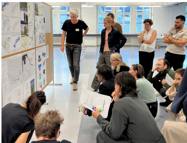
Spannende Diskussionsforen, Vernetzung & Wissensaustausch