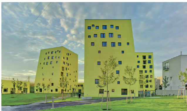
Von der Idee bis zur Umsetzungen! Play Studio und ÖSW- Fallow Land

EUROPAN ist der weltweit größte Städtebau- und Architekturwettbewerb. Er findet seit 1989 alle 2 Jahre als offener Ideenwettbewerb statt, der gleichzeitig Realisierungsstrategien mit entwickelt und sich an engagierte internationale Planer:innen unter 40 Jahren richtet. Als EUROPAN Standortpartner:in bringen Sie ein Wettbewerbsgebiet ein, für das die ambitioniertesten Teams Europas Projekte entwickeln.