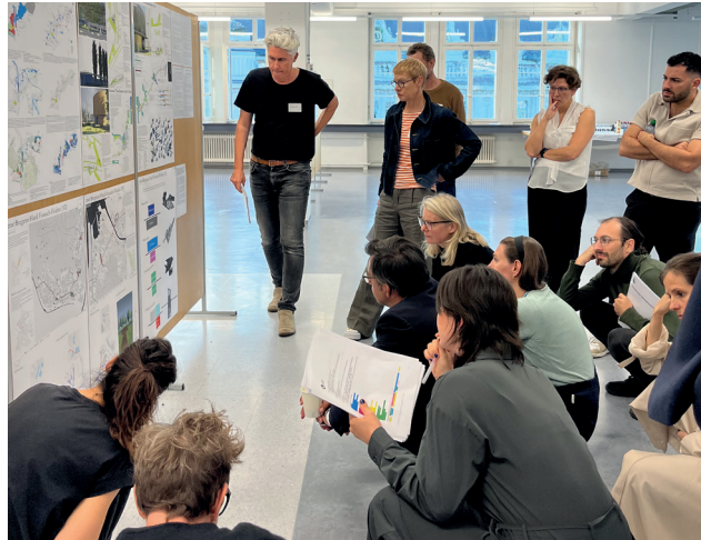
Spannende Diskussionsforen, Vernetzung & Wissensaustausch

EUROPANs Anspruch ist die Lebensräume europäischer Städte, Gemeinden und Regionen durch innovative Standortentwicklung nachhaltig zu verbessern. Unser einzigartiges Format initiiert einen Erneuerungsschub für Städtebau, Architektur und Landschaftsarchitektur. Es verknüpft visionäres Entwerfen mit konkretem Handeln, indem es eine Brücke zwischen innovativen Ideen und den für deren Verwirklichung notwendigen Umsetzungsprozessen baut. Dabei bringen wir engagierte Standortpartner:innen mit der jungen Generation ambitionierter Planer:innen zusammen und begleiten sie von der Idee bis zur Umsetzung zukunftsfähiger Handlungsstrategien und Projekte.