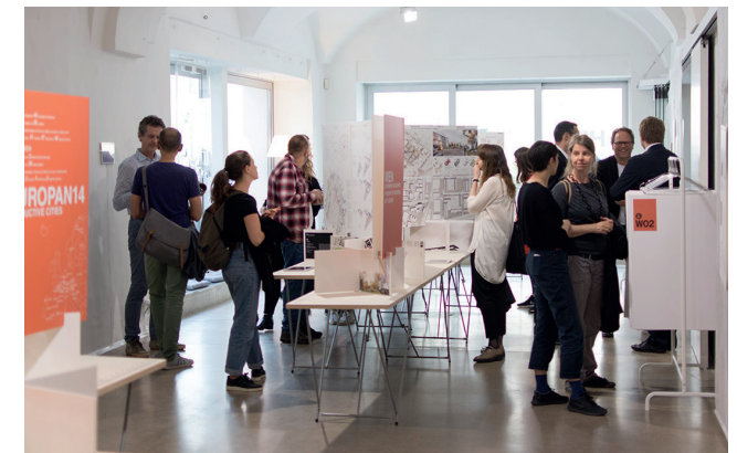
Ausstellung der Siegerprojekte an den Standorten

LEISTUNGSPAKET: Gesamtorganisation, Moderation, Preisgelder, Ausstellung, Kongresse, Publikationen, Workshops. Dank bestehender Fördermittel vom Bund erhalten EUROPANs Standortpartner:innen das EUROPAN Gesamtpaket zu einem außerordentlich günstigen Preis. Der auf drei Jahre aufgeteilte Finanzierungsbeitrag kann auch von mehreren Partner:innen finanziert werden.